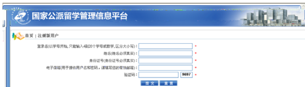
图 3-2 留学基金委信息管理平台新用户注册界面

（2）申请人打开浏览器，输入网址 http://apply.csc.edu.cn ，在页面左上方的“用户登录”中填入用户名和密码（如图 3-1 所示），即可登录国家公派留学管理信息平台（如图 3-3 所示）。申请人初次登录系统后，建议使用“修改密码”功能将密码重置。信息平台将陪伴留学人员的报名、录取