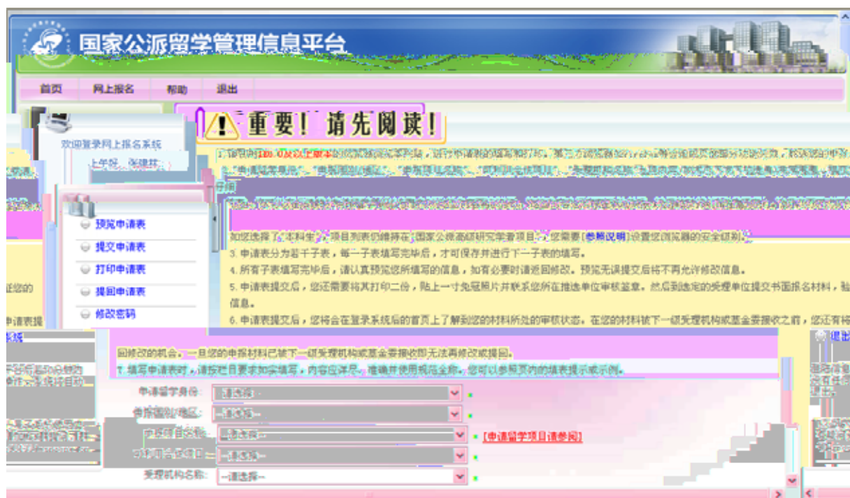
图 3-3 登录国家公派留学管理信息平台的界面