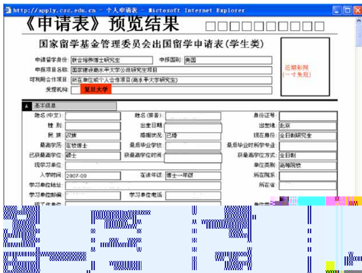
图 3-12 《国家留学基金管理委员会出国留学申请表》预览示意图