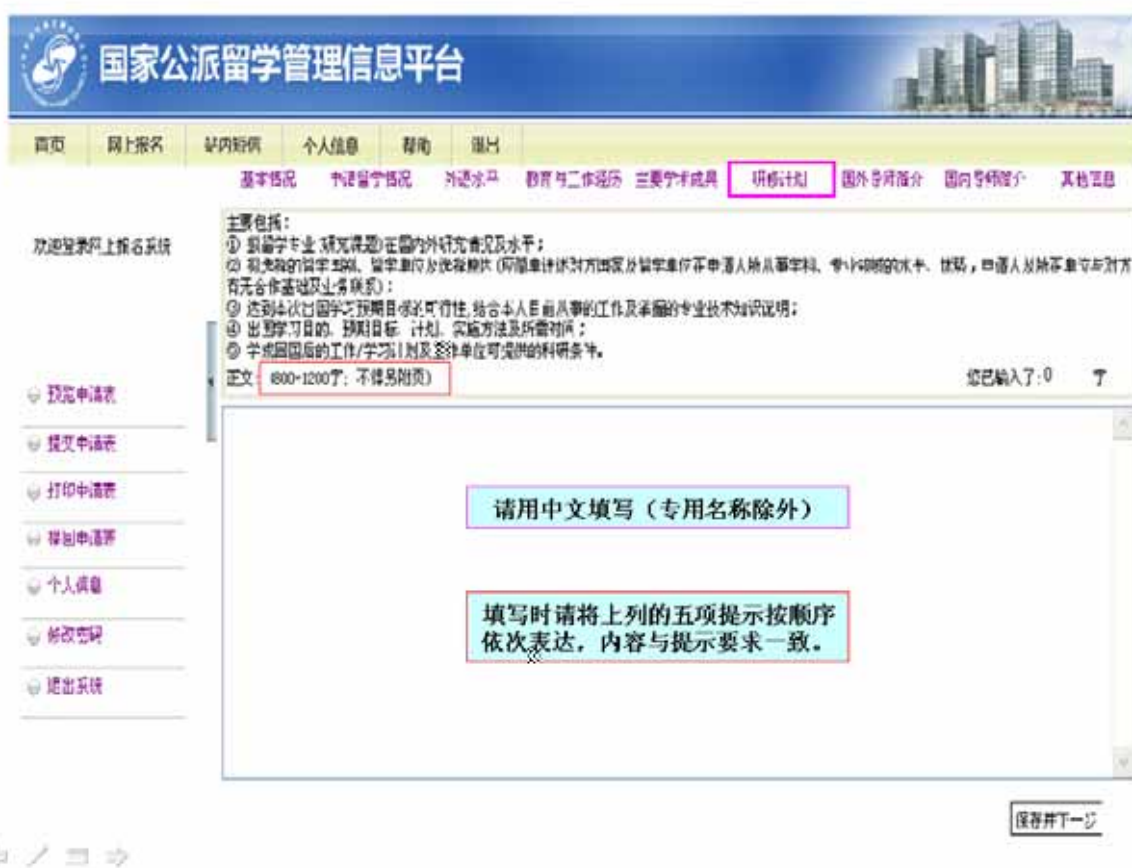
图 3-9 “研修计划表”填写页面