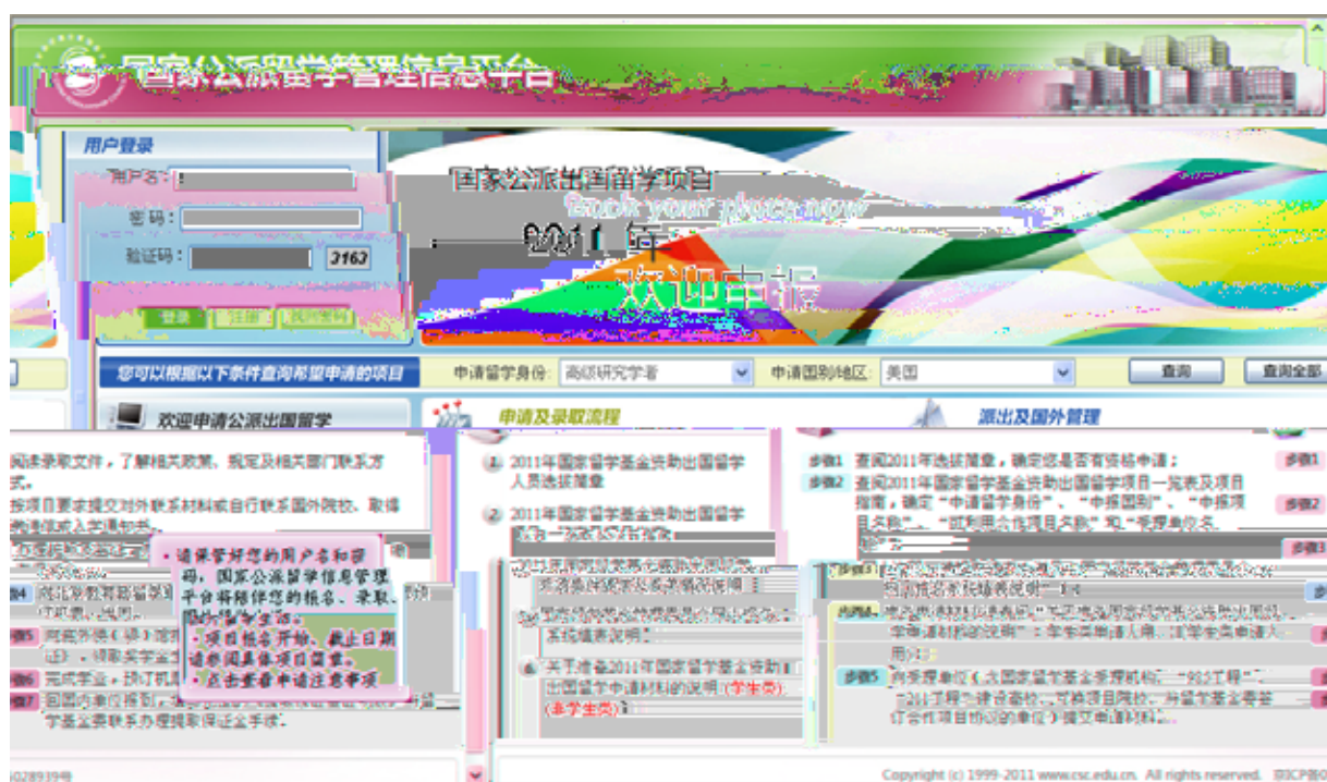
图 3-1 留学基金委信息管理平台界面

（1）申请人打开浏览器，输入网址 http://apply.csc.edu.cn ，登录到国家公派留学管理信息平台（如图 3-1 所示）。页面的左上方是用户登录入口，点击“注册”，即可进入申请人注册界面（如图 3-2 所示），输入基本信息进行注册，注册成功后，用户的用户名和初始密码将发送到注册时填写的邮箱。