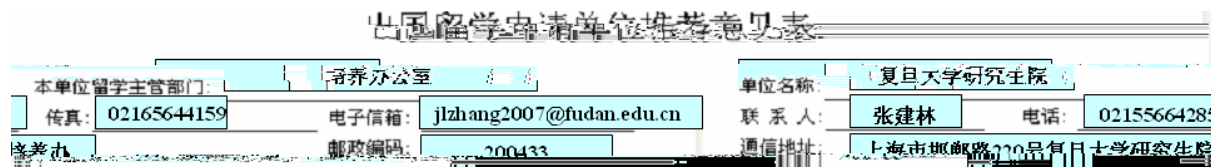
图 3-13 《出国留学申请单位推荐意见表》表头信息

申报人在填写完《国家留学基金管理委员会出国留学申请表》并进行预览时可以看到空白的《出国留学申请单位推荐意见表》。在确认无误后，请将《国家留学基金管理委员会出国留学申请表》以及空白的《单位推荐意见表》一并打印，并在打印出来的空白《单位推荐意见表》的表头部分填写如图 3-13 所示的信息或不填写：