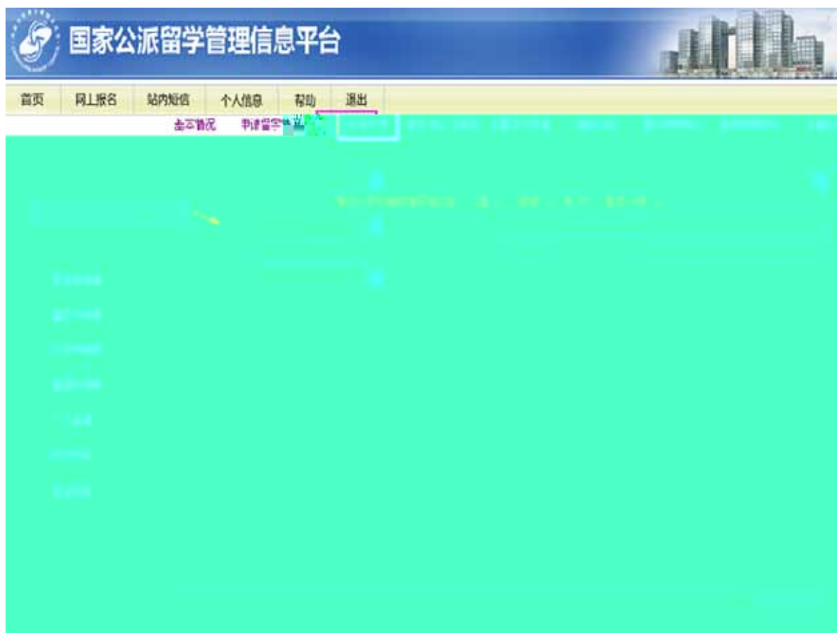
图 3-6 “外语水平表”填写页面

请从外语考试种类栏目下拉菜单中选择相应考试名称，如您参加的外语考试名称未直接列出，请选择“其他”并在“您参加的考试种类为”栏目中输入准确的考试名称。如您没有参加任何外语考试，请在外语考试种类栏目中直接选择“无”。